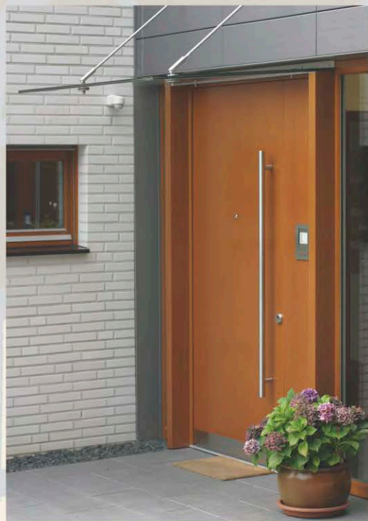
... elegante Hingucker