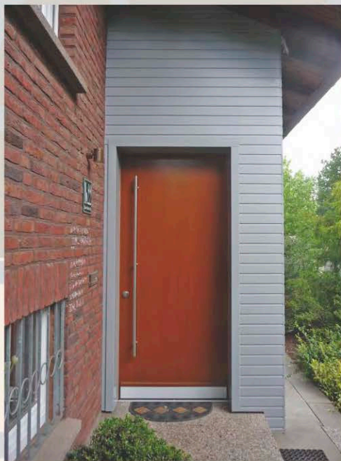
...Farbtupf für Puristen