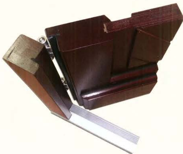
Querschnitt durch eine Rahmentür mit Holzfüllung